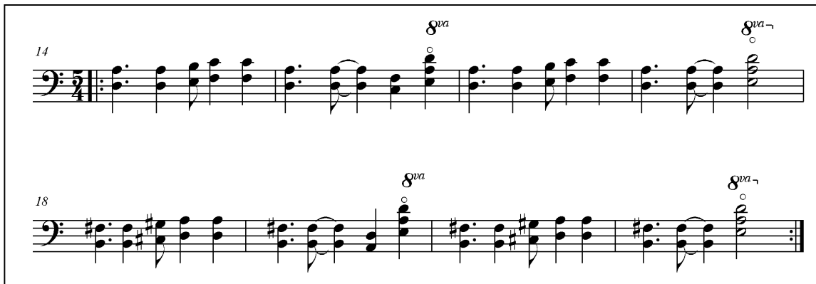
Fig. 3.16 Della Terra (A.Fedrigo) Riff del basso.

Poi ho affrontato la sezione A, che prevede che il clarinetto suoni una melodia sopra al riff di basso e ai due accordi ora suonati dalla chitarra (in figura 3.17 la parte originale).