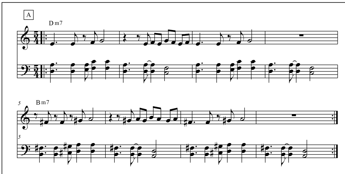
Fig. 3.17 Della Terra (A.Fedrigo) Tema A per basso e chitarra.

Ho deciso di condensare il tema e la parte di armonia, il riff sarebbe andato perso in questa sezione, ma potevo almeno usare la corda a vuoto di Re per avere un po' di sostegno ritmico (fig. 3.18)